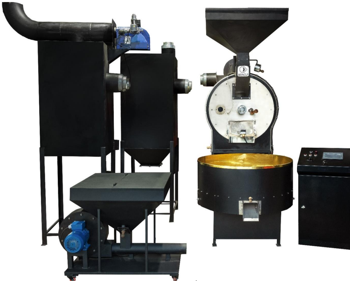
نمونه دستگاه رست ۶۰ کیلویی

تولیدکننده تخصصی دستگاه های رست قهوه، بسته بندی و تجهیزات مرتبط