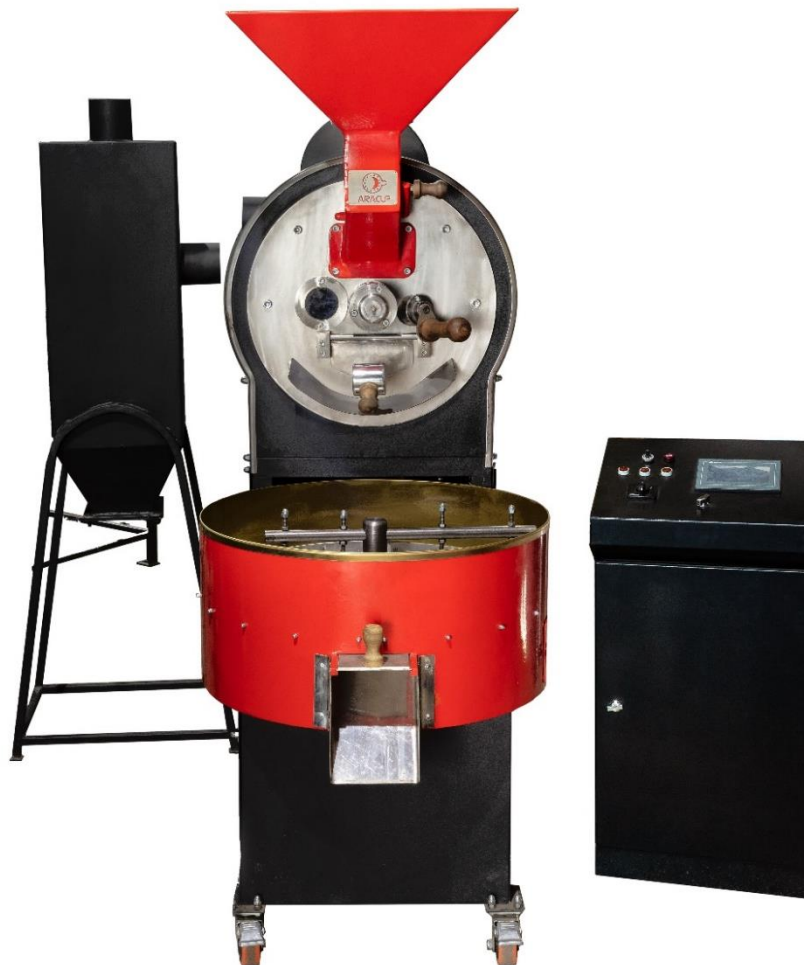
نمونه دستگاه رست ۵ کیلویی

تولیدکننده تخصصی دستگاه های رست قهوه، بسته بندی و تجهیزات مرتبط