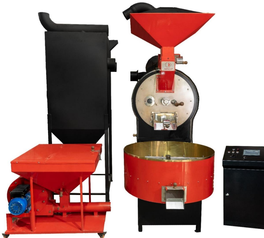
نمونه دستگاه رست ۳۰ کیلویی

تولیدکننده تخصصی دستگاه های رست قهوه، بسته بندی و تجهیزات مرتبط