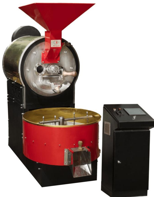
نمونه دستگاه رست ۲ کیلویی

تولیدکننده تخصصی دستگاه های رست قهوه، بسته بندی و تجهیزات مرتبط