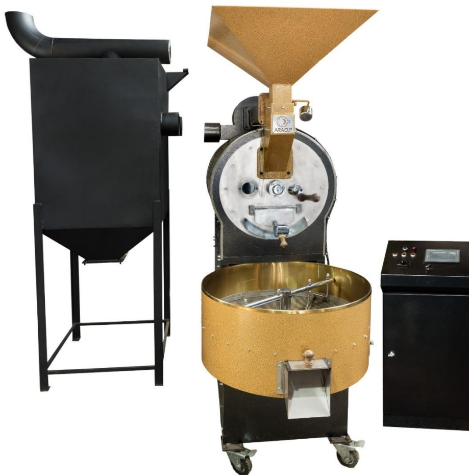
نمونه دستگاه رست ۱۵ کیلویی

تولیدکننده تخصصی دستگاه های رست قهوه، بسته بندی و تجهیزات مرتبط